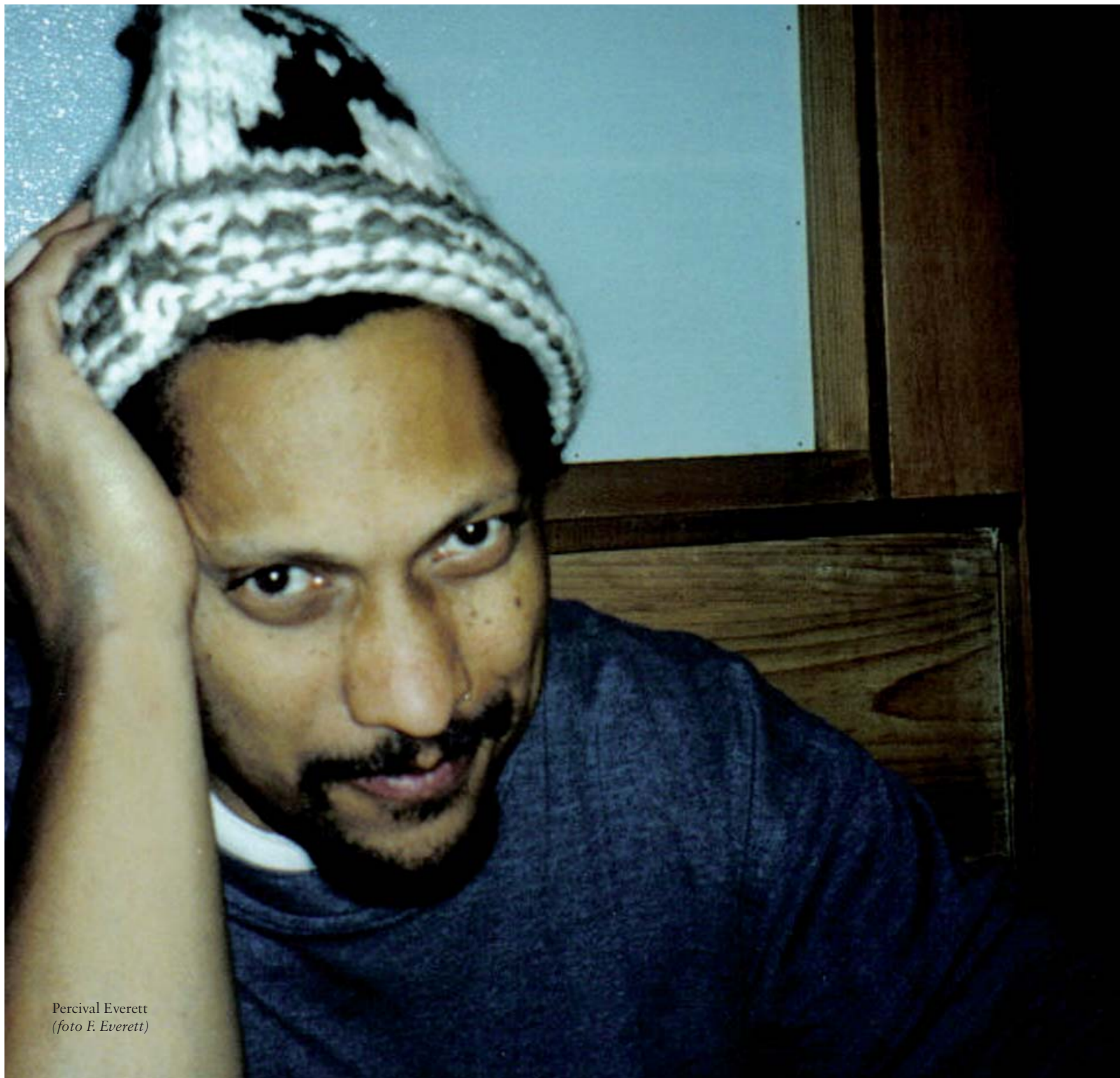
Percival Everett