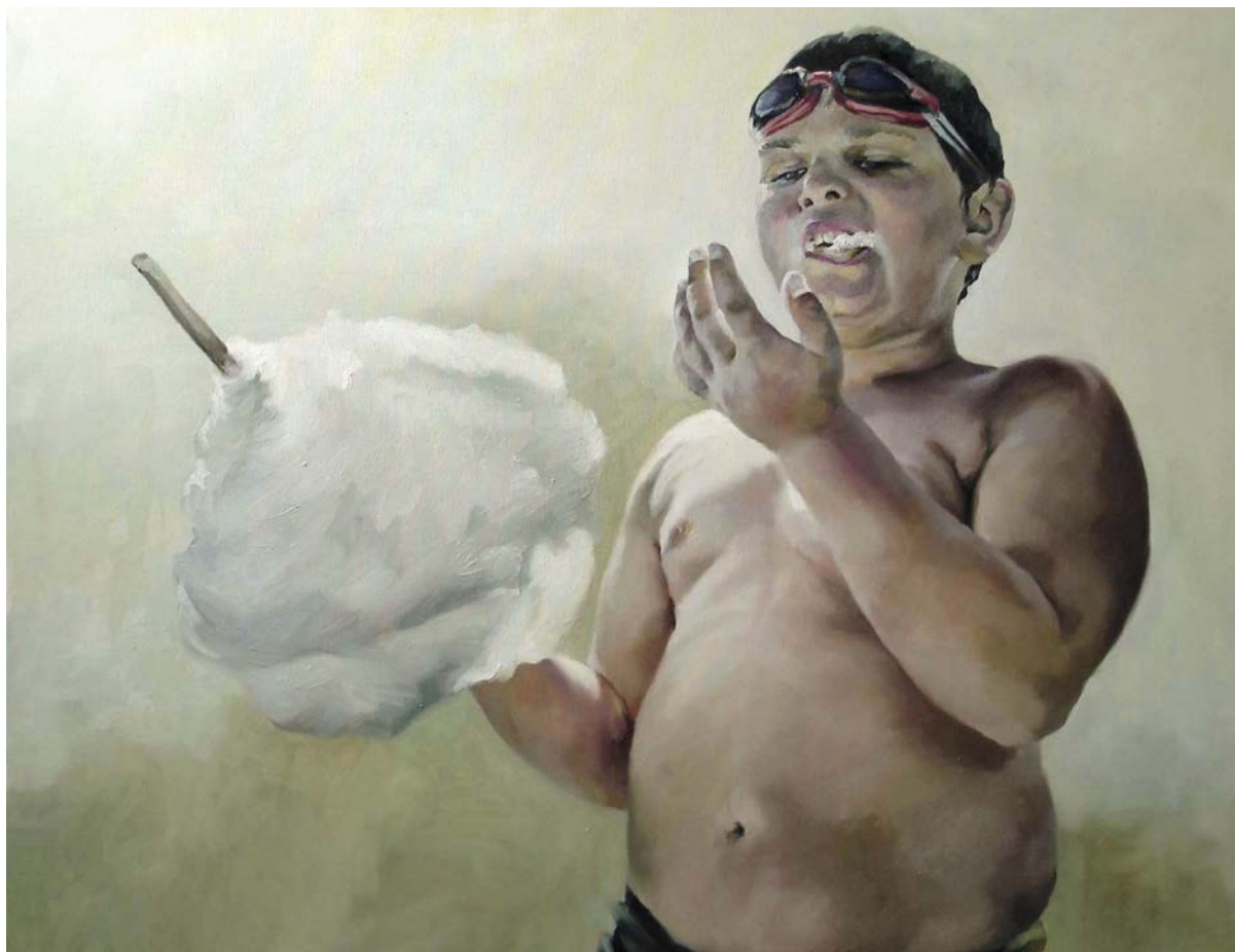
Infant Obesity (2010), dipinto a olio dell'artista Anca Danila, nata a Năsăud, Romania, nel 1982.

Athos Zontini ha scritto un romanzo d'esordio diverso dal solito: una favola nera, in cui i luoghi dell'infanzia non sono boschi, castelli e casette di marzapane, ma quelli più comuni