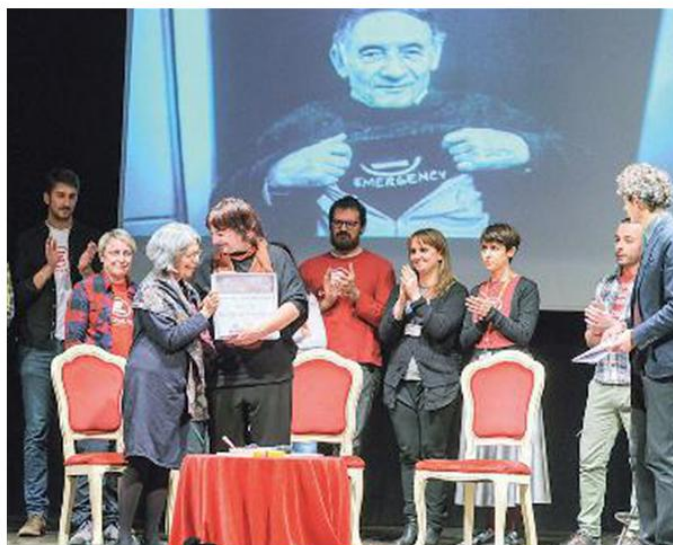
ROMANZI Nelle foto, alcuni momenti della premiazione delle passate edizioni al teatro di Porto San Giorgio