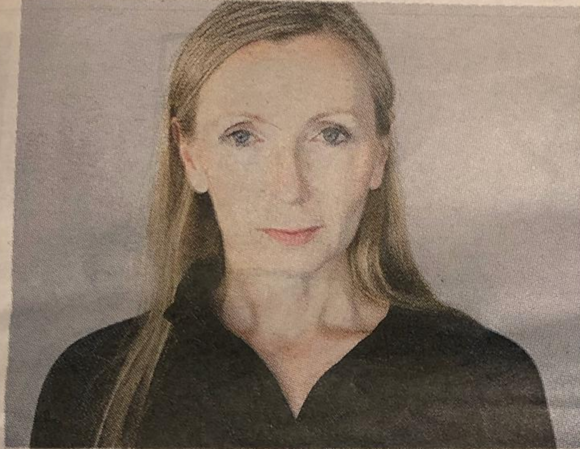
La scrittrice irlandese Anna Burns