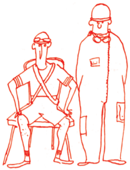
BALDINI E CASTOLDI