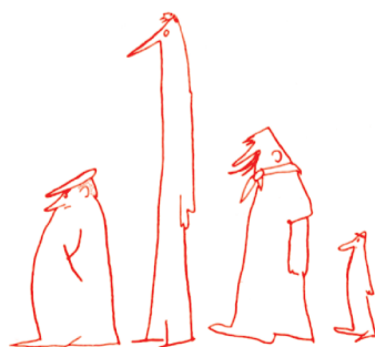
FELTRINELLI, FRASSINELLI, ZANICHELLI, CORTICELLI